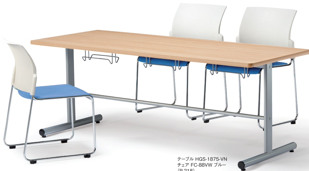
テーブル HGS-1875-VN チェア FC-88VW ブルー (P.218)