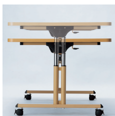
■ラチェット式高さ調節

テーブルの高さを、H660からH800まで7段階20mmピッチの高さ調節が可能です。(高さ確認の目盛り付)