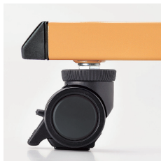
■アジャスト機能付キャスター

キャスター上部のリングにより高さ調節できます。制動力の高いリフトロック式ストッパーです。