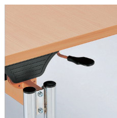
■折りたたみ操作レバー

テーブルの高さを、H660からH800まで7段階20mmピッチの高さ調節が可能です。(高さ確認の目盛り付)