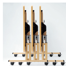
■サイドスタッキング